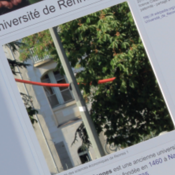
La Faculté des sciences économiques de Rennes 1

Version de l'article du 16 avril 2011 à 01:16, disponible sous licence Creative Commons - paternite - partage à l'identique http://fr.wikipedia.org/wiki/Université_de_Rennes